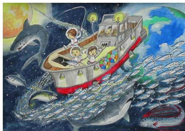
6年生最優秀賞・ぐんま天文台長賞 鶴田 珠輝(富岡小) 「天の川は魚だった!!さあ、みんなで釣り上げろ!!」

令和元年度 ぐんま天文台児童絵画展実績 参加校数: 県内108校 参加人数: 2,257人 (うち、天文台館内展示386人)