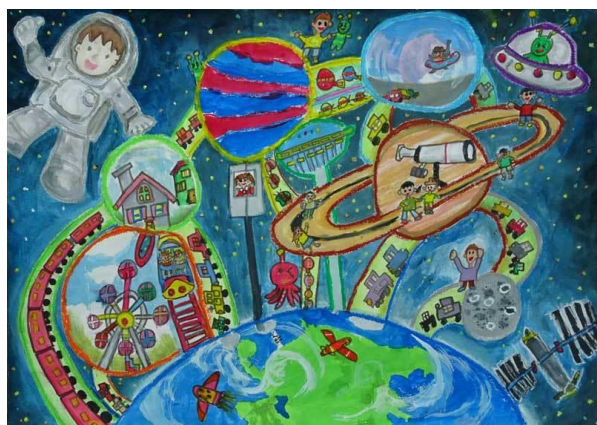
3年生最優秀賞 柴山 拓真(高崎南小) 「色んな星で遊びたい」