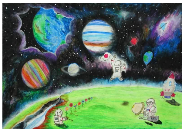
4年生最優秀賞 江原 璃乃(岩鼻小) 「新しい宇宙見つけた!!」